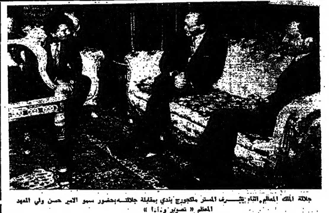
جلالة الملك المعظم، اتاه يشرف المستر ماكجورج بندي بمقابلة جلالتهم بحضور سبر الاجر حسن ولي المعهد المعظم

الجمعة في ٢٣ ربيع الثاني سنة ١٣٨٨ هـ الموافق ١٩ تموز سنة ١٩٦٨ م رقم العدد ٤٥٨ AD - DUSTOUR ARABIC DALY NEWSPAPER AMMAN FRIDAY 19/7/1968 No : 458